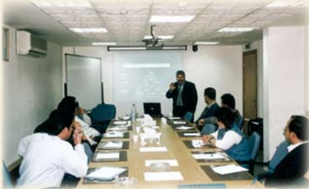
من الورش التدريبية للجائزة في الدائرة

وعملت فرق الجائزة المشكلة في دائرة الموازنة العامة لكل معيار من معايير الجائزة على حصر وتحديد الوثائق اللازمة كدليل مدعم للإجابة على أسئلة الجائزة وتوثيقها حيث شارك كافة موظفي الدائرة في هذه العملية لتصبح جزءا من ثقافتهم ورغبتهم بالتطور والتحديث.