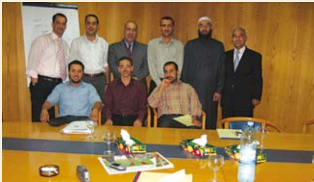
الدورة التدريبية التي عقدت في بيروت