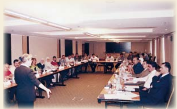
ورشة عمل للجائزة في العقبة