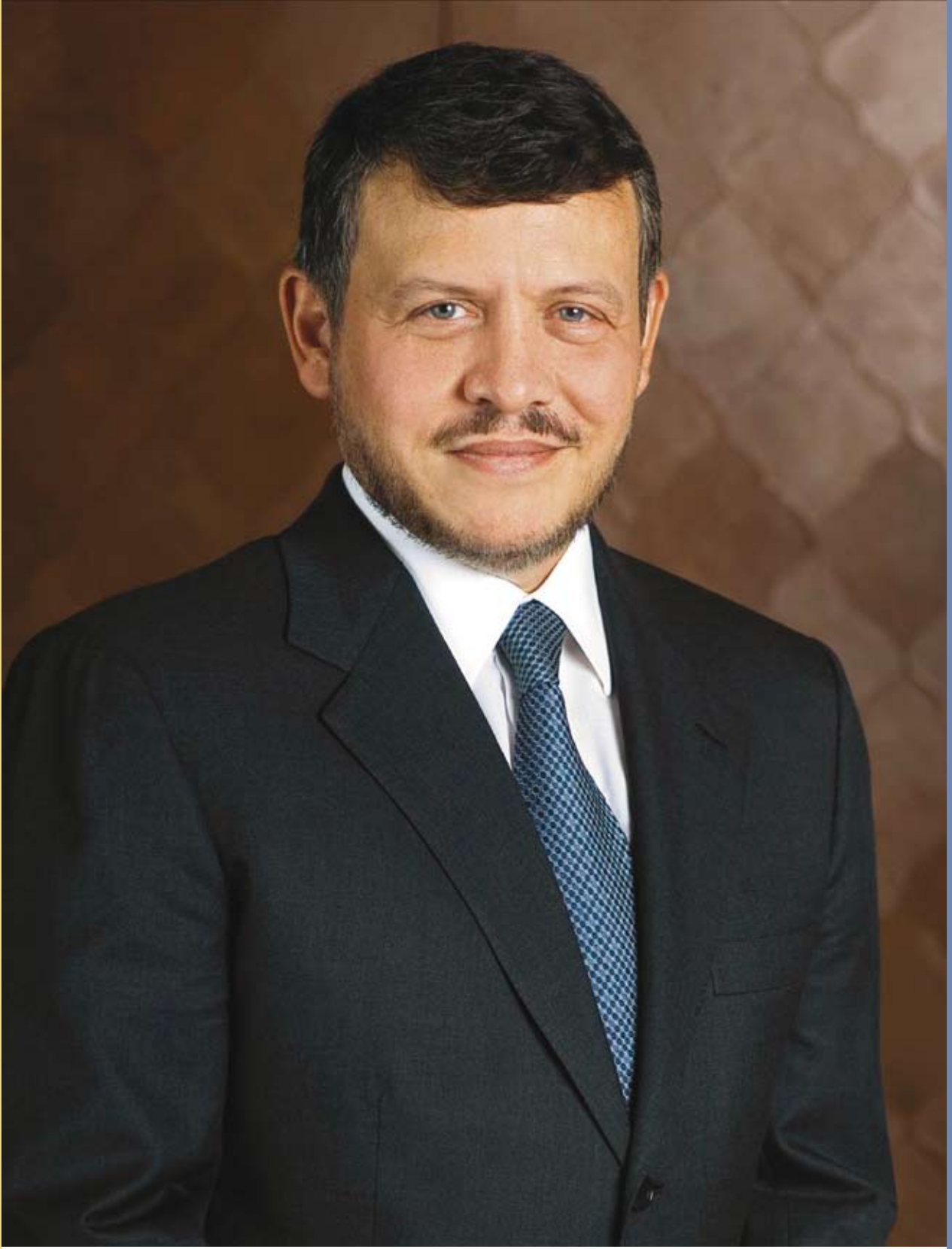
صاحب الجلالة الملك عبد الله الثاني ابن الحسين المعظم