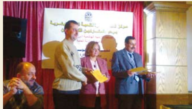
الدورة التدريبية التي عقدت في دمشق