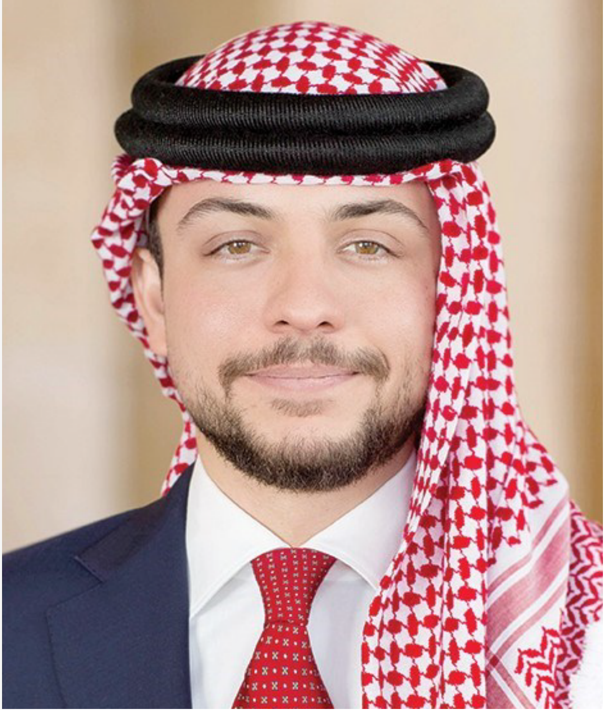
صاحب السمو الملكي الأمير الحسين بن عبدالله الثاني ولي العهد المعظم