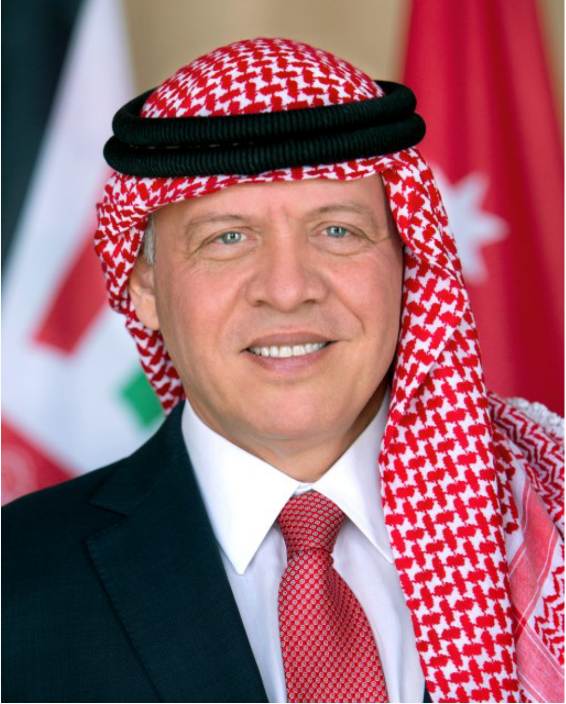
صاحب الجلالة الهاشمية الملك عبدالله الثاني ابن الحسين المعظم